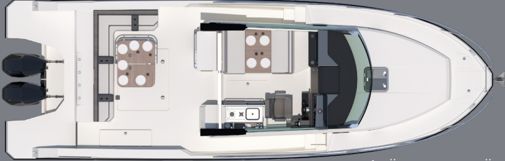
DECK MODULE-2 AND COCKPIT/ GÜVERTE MODÜL-2 VE KOKPİT